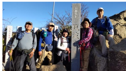
「山頂で集合記念写真」

山頂まで行けるコースを選択して下さったり、いろいろな所でアドバイスをして勇気付けて下さった為、