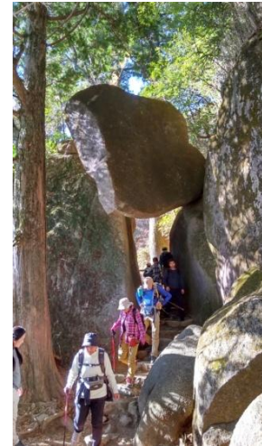
「弁慶の七戻りを通過」

第3回の活動は12月10日(日)筑波山でした。男性が3名、女性は2名で、初めての参加でした。