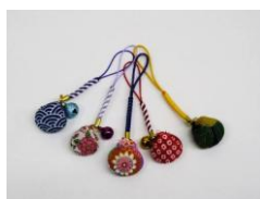
貝を母のストラップ