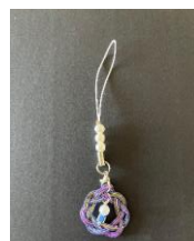
水引でストラップ