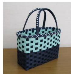
クラフトテープのバッグ