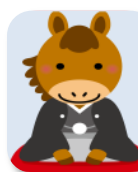
柿沼 正明 会員