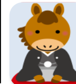
竹ノ谷 伸男 会員