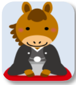
石川 幸男 会員

掲載場所順(右→左/上→下)、掲載順(会員番号の古い順→寄稿文有りの方→お名前の方)、顔写真 掲載のご希望はありませんでした。