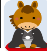
藤本 節雄 会員