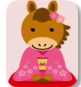
木村 春枝 会員