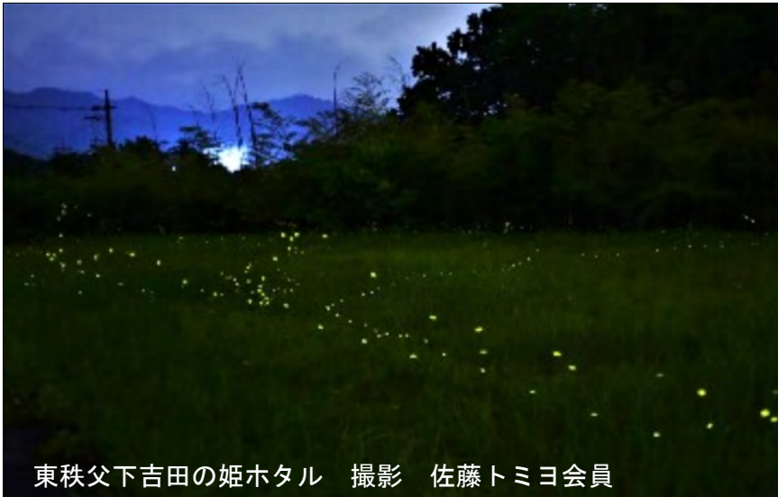
東秩父下吉田の姫ホテル

数、契約金額ともに右肩上がりです。推移し、順調に事業実績を積み上げてきましたが、令和2年に発生した新型コロナウイルス感染症の感染拡大が長引き、併せて異常気象、会員の高齢化と、この3年間で事業実績を大きく落としてしまいました。35年の歴史の中でこれほど大きな社会環境の変化は無く、センターも大きな転換期を迎えています。