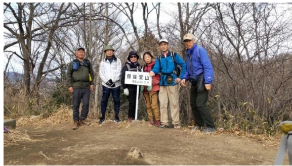
第6回 2024.2.17 鐘撞堂山(寄居町)