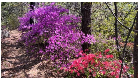
山ツツジを觀賞(両崖山)