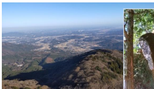
山頂よりつくば市、 遠方は東京方面を臨む