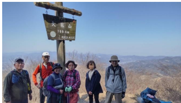
第7回 2024.3.16 大霧山(東秩父村)