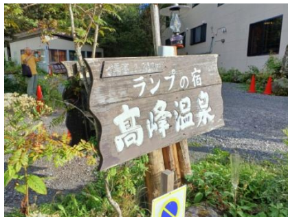
硫黄が匂う高峰温泉ランプの宿