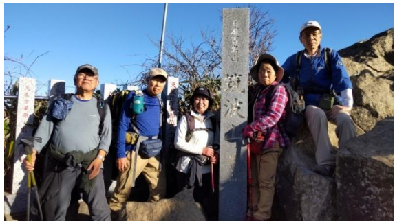
第3回 2023.12.10 筑波山(つくば市)