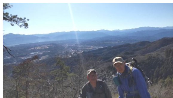
武蔵展望台にて(背景に武甲山)