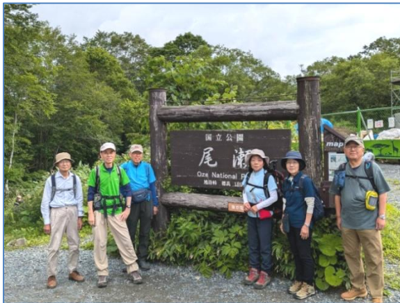
第11回 2024.7.20 尾瀬ヶ原(片品村)