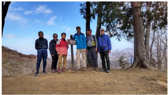
虎ヶ岡城址山(美里町)