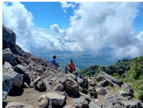
トーミの頭より小諸市を一望