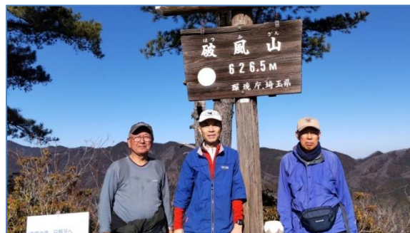
第4回 2024.1.6 破風山(皆野町)