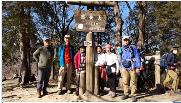
第5回 2024.1.28 長瀬川プス～宝登山(長瀬町)