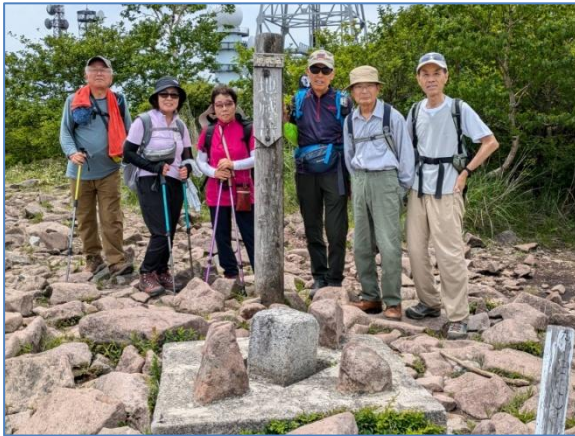
第10回 2024.6.22 地藏岳(前橋市)