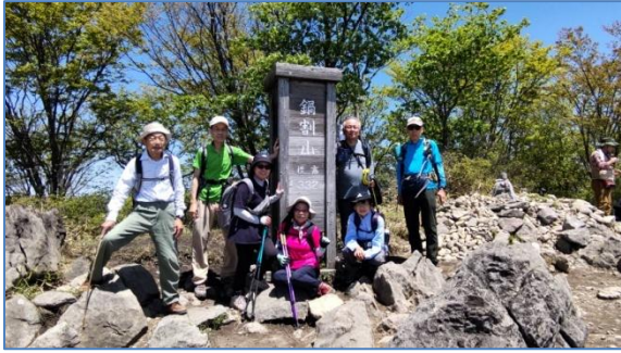
第9回 2024.5.18 鍋割山(前橋市)