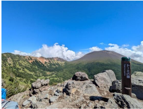
トーミの頭より前掛山/浅間山