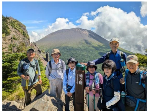
槍ヶ鞘より、左側にトーミの頭が迫る