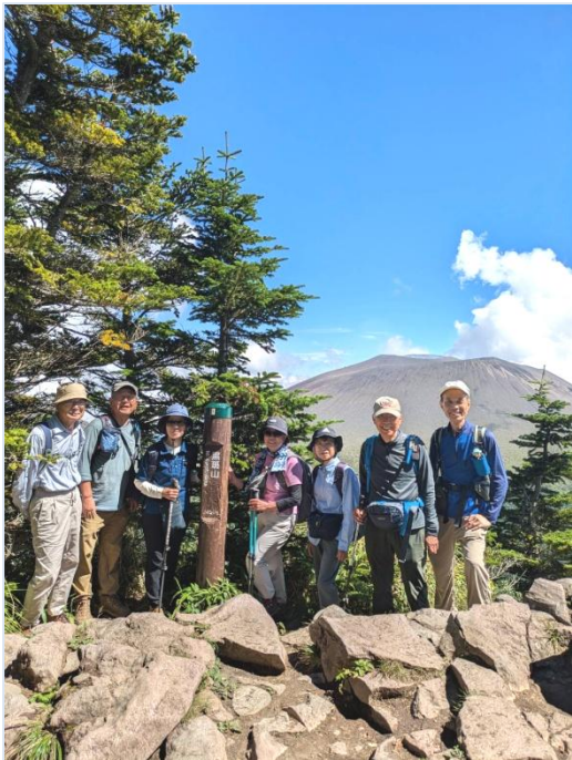
第12回 2024.9.14 黒斑山にて(くろふやま) (小諸市)背景は前掛山/浅間山