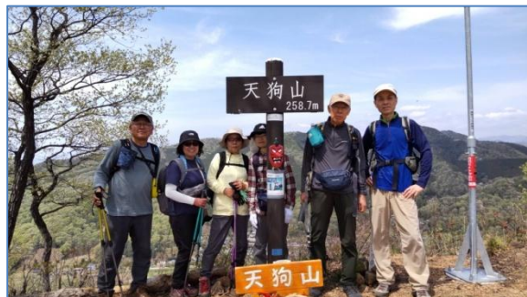
第8回 2024.4.13 天狗山(足利市)