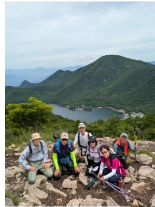
背景：大沼、赤城神社、 赤城最高峰の黒檜山