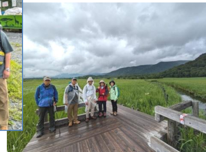
牛首の辺りは雨模様／木道とコウキアガ