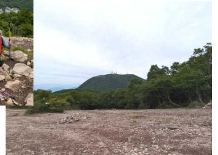
長七朗山から地藏岳を見る