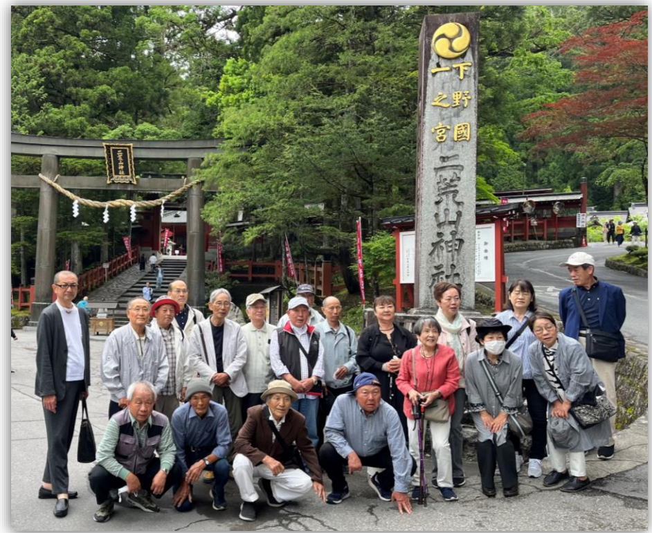
日光二荒山神社にて 集合写真