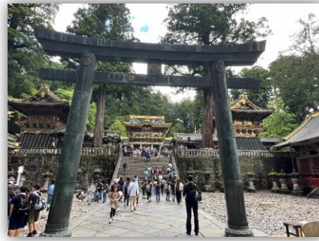
日光東照宮 陽明門を望む