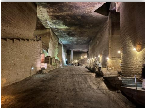
大谷石地下採掘場跡