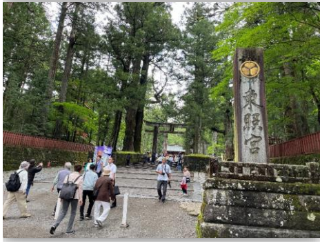
日光東照宮 石鳥居前